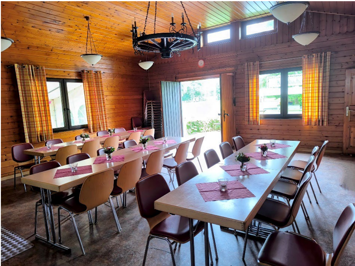
Blick von der Theke zur Eingangstür / Terrasse